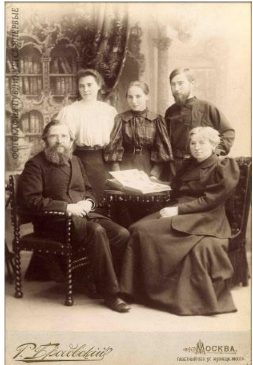
А. И. Чупров с семьёй